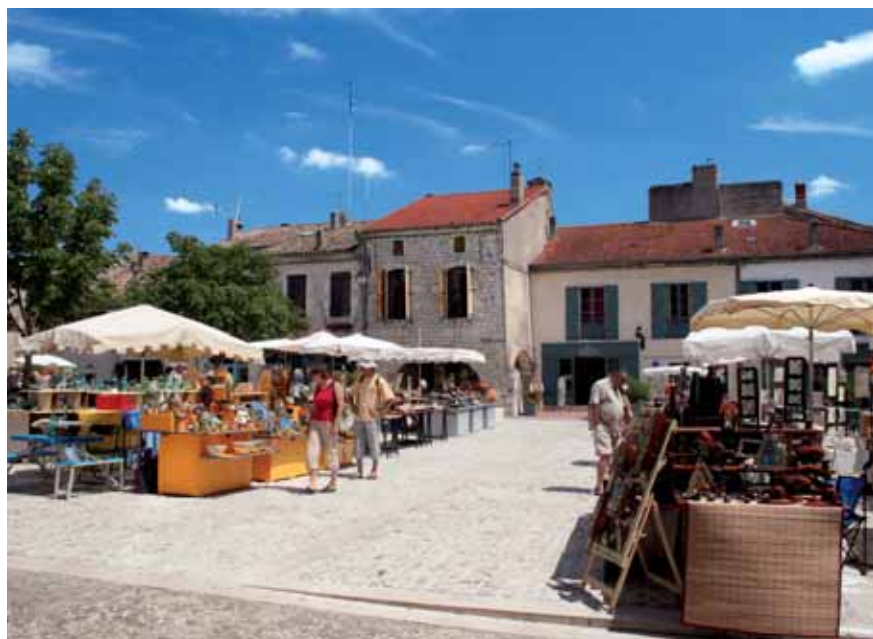
Les foires, marchés et Salons artisanaux contribuent à la valorisation de savoir-faire, mais aussi à la promotion de certains territoires.

comme la localisation et les caractéristiques géographiques, la richesse du patrimoine, sans oublier, bien évidemment, l'accessibilité fortement liée à la qualité des infrastructures.